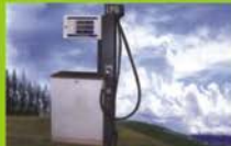
CNG / LPG Dispensers