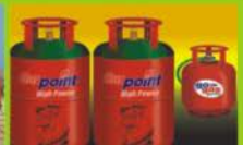
Packed Cylinder Marketing