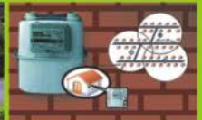
RFID Metering Solutions