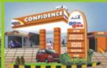
Auto LPG Station