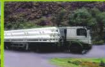
ANG Pipeline on the move