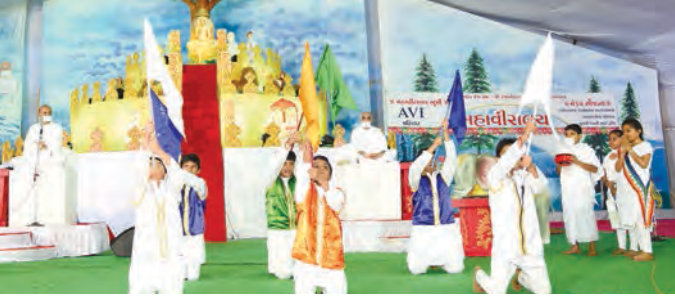
LNL બાળકો પર્વાધિરાજ પર્યુષણ મહાપર્વનું સ્વાગત-ભાવનૃત્ય

હજારો બાળકોએ એક સાથે પ્રભુને કહ્યું, “ઓ ગોડ ! આય એમ સોરી, પ્લીઝ ફરગીવ મી ! !”