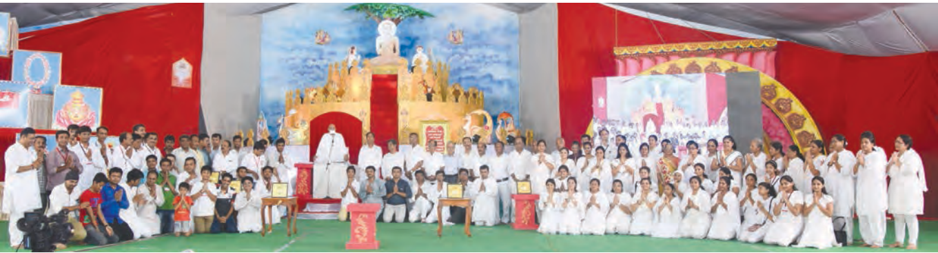
પર્વાધિરાજ પર્યુષણની ભવ્યતા અને વ્યવસ્થા માટે રાત-દિન મહેનત કરતાં સેવાભાવી ભક્તો