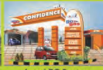
Auto LPG Station