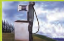
CNG / LPG Dispensers