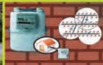
RFID Metering Solutions