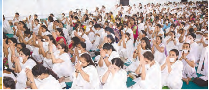
નમોત્યુણની મુદ્રામાં પ્રભુને વંદના કરતાં ભાવિકો