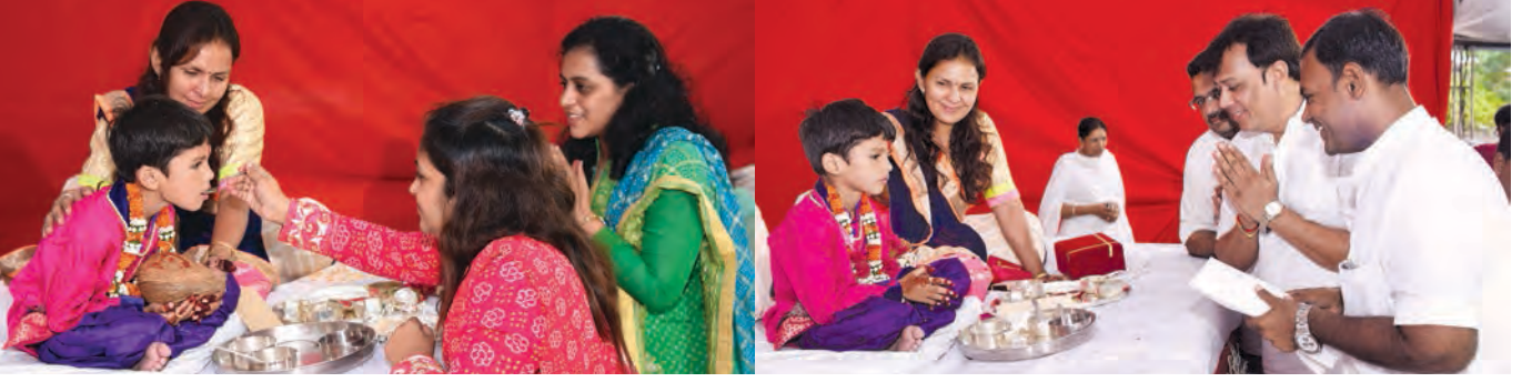
બાળ તપસ્વીને પારણા કરાવતા શ્રી છેડા પરિવાર