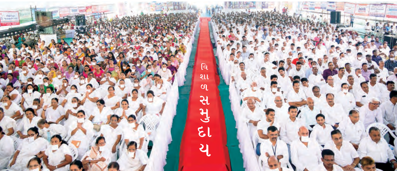
ગુરુ જ્ઞાનવાણીનું શ્રવણ કરતાં સમસ્ત અમદાવાદ અને ગુજરાતના જૈન-અજૈન ભાવિકો