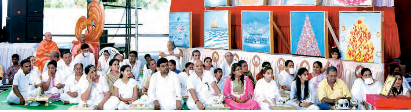
ચૌદ મહાસ્વપ્ન અને પારણીયાના લાભાર્થીઓ સ્વપ્ન પ્રતિક સાથે