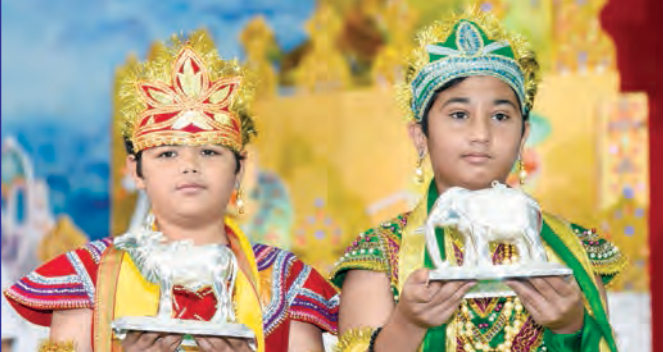
દિવ્ય સ્વપ્નના પ્રતિક સાથે મલકાતાં બાળકો આગમ અને પરમ

પૂજ્ય ગુરુદેવની સાધર્મિકને સહાય અને માનવતાની જ્યોતને ઝળહળતી રાખવા ભાવિકોએ મન મૂકીને ગુરુચરણે ભક્તિ અર્પણ કરતાં સવા ત્રણ કરોડ જાહેર થયા હતા. ચૌદ મહા સ્વપ્નનો લાભ તો ઉદાર હૃદયા શ્રીમંતોને મળ્યો હતો જ્યારે ચૌદ નાના સ્વપ્ન પ્રતિકનો લાભ ડ્રો દ્વારા ભાગ્યશાળીઓને મળ્યો ત્યારે સહુ પૂજ્ય ગુરુદેવની પ્રેરણા અને સ્વયંના પુણ્યોદયને જાણી ભાવુક થઈ ગયાં હતાં.