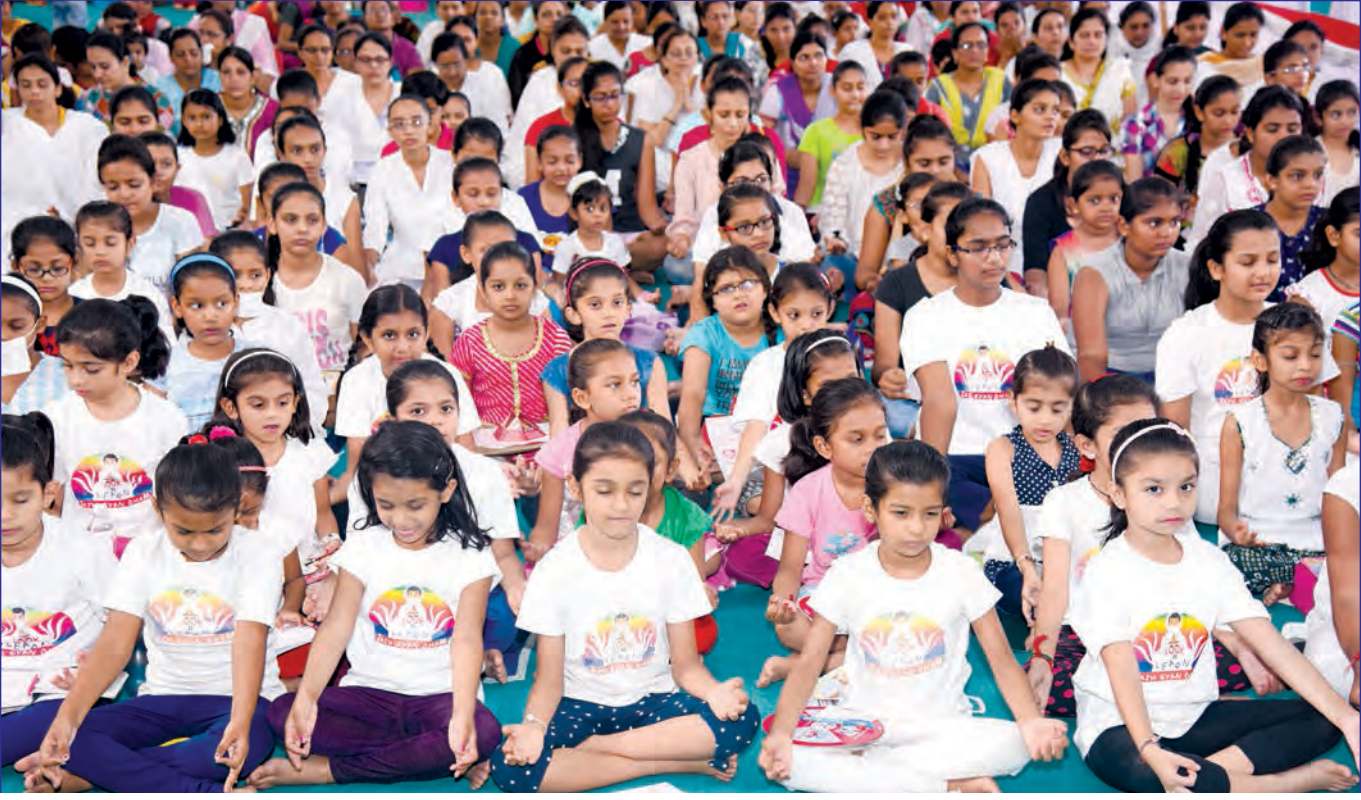
બાળ પર્યુષણમાં બાળકોએ કર્યા આલોચણા

બાળકોને કરાવેલી બાળ આલોચનાએ સહુ માટે અનોખું આર્કષણ ઉપજાવ્યું હતું. બાળ હૃદયને પ્રિય અને બાળ શૈલીમાં કરાવેલી આ આલોચના દ્વારા બાળકોએ પોતે