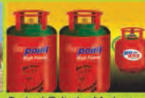
Packed Cylinder Marketing