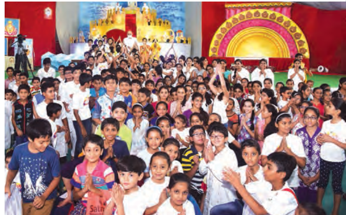
દેવગુરુની ભક્તિમાં તલ્લીન બની કીર્તન કરતા બાળકો