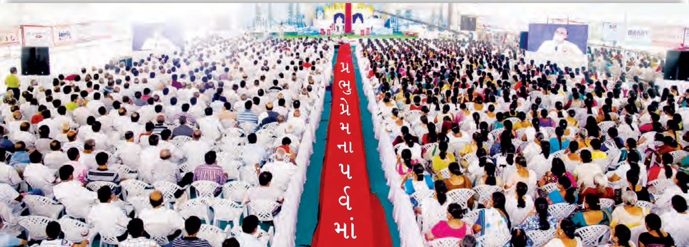
મહાવીરાલયના વિશાળ પટાંગણમાં પ્રભુ મહાવીરની જ્ઞાનવાણીને ગુરુ મુખે શ્રદ્ધા કરતાં ભાવિકો