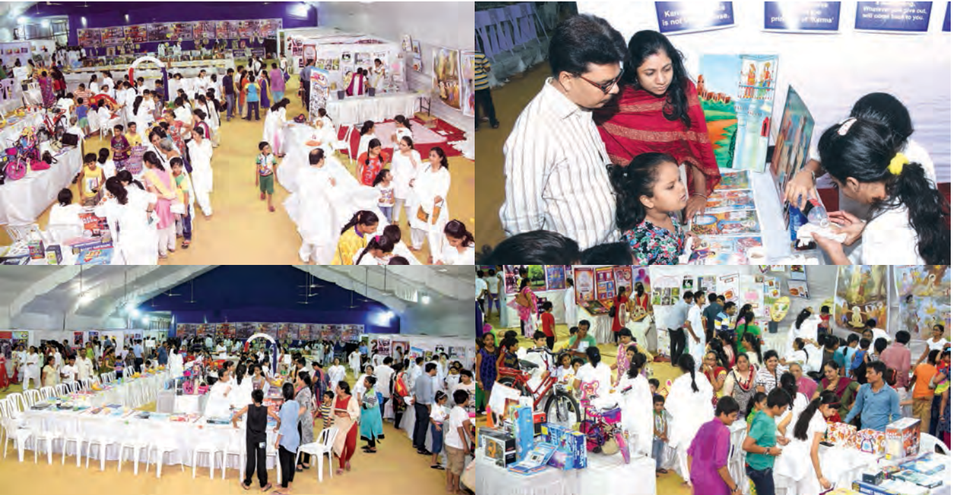
લુક એન લર્ન બાળકો દ્વારા જૈન એકઝીબીશન

કેવળજ્ઞાનના ભવ સુધીના મોડલ પ્રોજેક્ટસ હતાં આ એકઝીબીશનના આકર્ષણનું કેન્દ્ર ! પણ પળની જાગૃતિ સાથે કેવી રીતે આહાર પ્રત્યે વિવેક રાખવો અને જીવોની હિંસા કર્યા વિના સ્વયંના સૌંદર્યને કેવી રીતે દીપાવવું એટલે 'બ્યુટી વિધાઉટ ક્યુઅલ્ટી' ના પ્રોજેક્ટસ હતાં એકઝીબીશનના મોરલ મેસેન્જર !