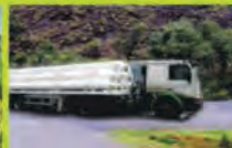
ANG Pipeline on the move